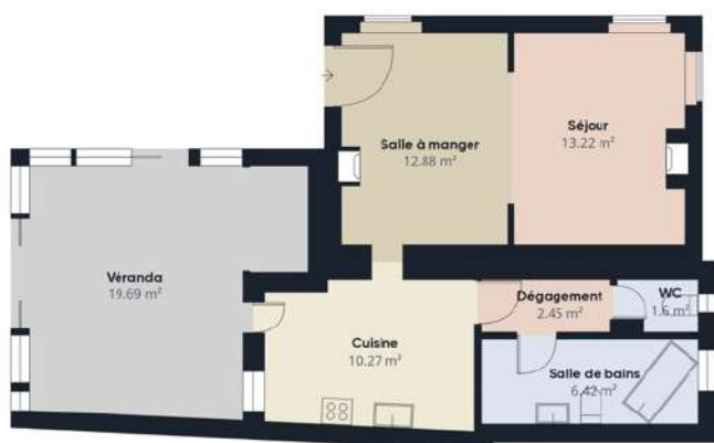
Niveau 0 Bâtiment 1