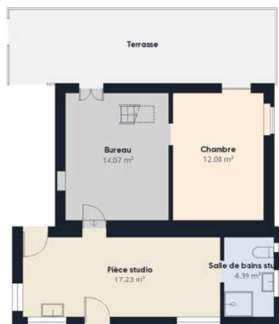
Niveau 1 Bâtiment 1